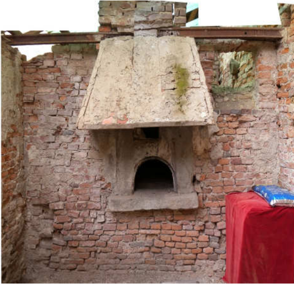
Parete Ovest con la cappa del forno.