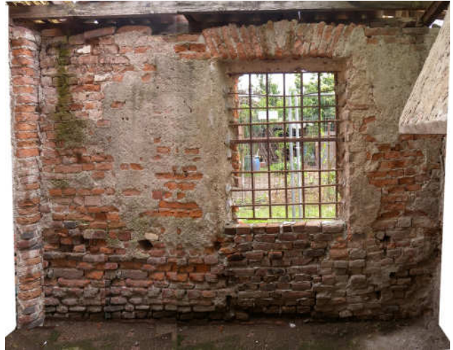
Parete Sud con la finestra munita di una inferriata.