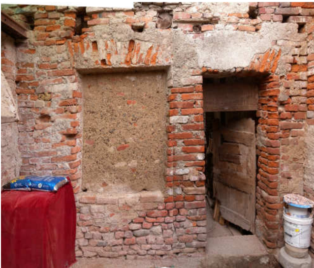
Parete Nord con il vano della porta di accesso. Parete Est, con parte della muratura che reggeva la falda del tetto.